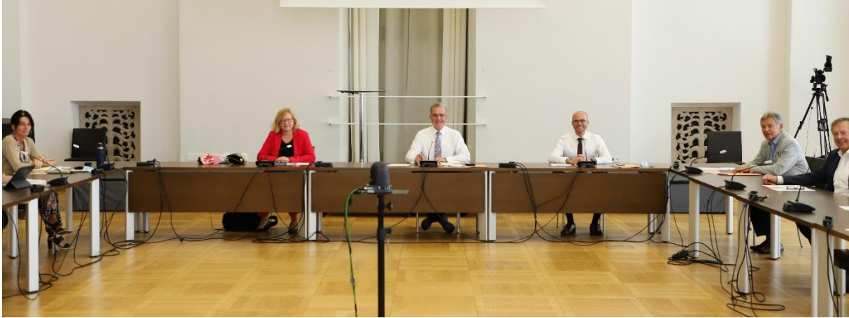
Sitzung des Fraktionsvorstands im Senatssaal des Maximilianeums

Thema waren diese Woche auch die Belange von Senioren . Neben Kindern sind oftmals ältere Menschen in Entscheidungsprozessen unterrepräsentiert – obwohl der Anteil der Senioren im Freistaat kontinuierlich steigt. Daher haben wir als Fraktion einen Antrag zum Bayerischen Seniorenmitwirkungsgesetz in den Landtag eingebracht. Damit wollen wir die Inklusion von älteren Menschen auf den Weg bringen, um deren Mitwirkungsrechte zu stärken: Neben der aktiven Teilhabe bei wirtschaftlichen, sozialen, kulturellen und politischen Entscheidungen sollen die Belange von Senioren ausdrücklich in der Bayerischen Verfassung verankert werden. Durch das sogenannte Seniorenmitwirkungsgesetz wird eine organisierte Form der politischen Beteiligung älterer Menschen im Sinne einer parteilich neutralen, überkonfessionellen und verbandsunabhängigen Plattform etabliert. Damit schaffen wir als erstes Bundesland in Deutschland eine gesetzliche Basis für die Mitwirkung von Senioren, vor allem auf kommunaler Ebene – ohne das Selbstverwaltungsrecht von Städten und Gemeinden zu beschneiden. Neben bereits erfolgreichen Mehrgenerationenhäusern startet nun eine Mehrgenerationenpolitik in Bayern, die alle Altersklassen gleichermaßen miteinbezieht. Neben verbessertem Kinderschutz integrieren wir ältere Menschen noch stärker in unsere Gesellschaft – schließlich haben sie Bayern jahrzehntelang aktiv mitgestaltet und sollten im Ruhestand nicht vergessen werden.