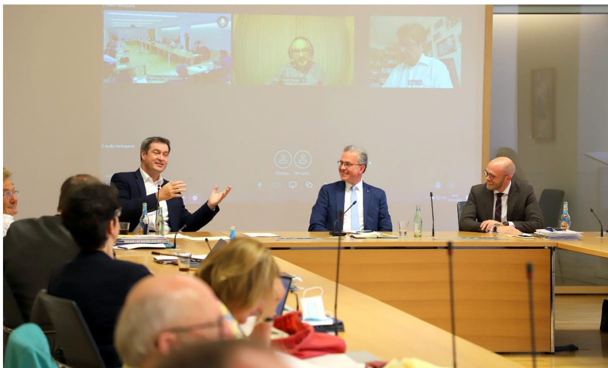
Ministerpräsident Söder in der Fraktionssitzung